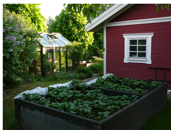
En villaträdgård med plats för det mesta

En vecka senare sken solen och vi träffades i en annan del av Enebyberg och en annan slags trädgård. Betydligt mindre men ändå stor med sina 1400 kvadratmeter. Bakom familjen Björks trädgård vid Gamla Täbyvägen låg lika mycket arbete och kärlek.