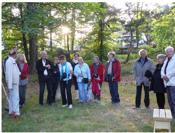
Vi letar efter fornminnet som inte längre finns