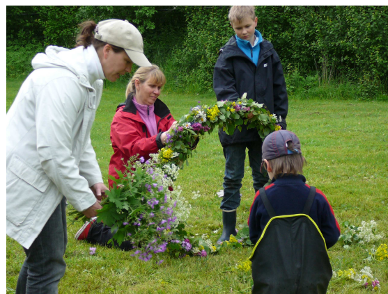
En skön konst att klä midsommarkransar.

Människor i alla åldrar jobbade ihop mot ett gemensamt mål, löste något som kunde ha blivit en jättekris. Alla kände inte varandra förut men alla bidrog.