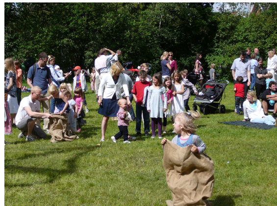
Säcklöpning uppskattas av alla åldrar.

samordning och lekledning, till familjerna Jerveland, Norrbom med flera för skogsarbete.