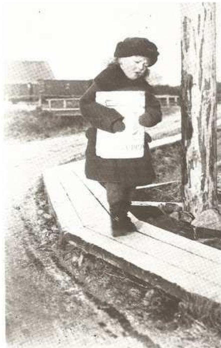
En bild på en annan Bengt vid Näsby station på 1920-talet. Bild från Täby Hembygdsförenings skrift nr 18: Ytterby Roslags-Näsby Skola och samhälle i Täby.

Men det kom bara knaster och oljud ur radioapparaten. Man fick gå hem igen och få tillbaka 25-öringen som man betalat i entré. Litet senare upprepades programmet och då fungerade det bra.